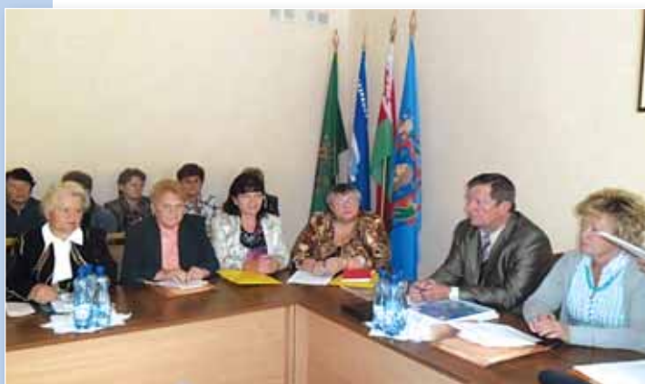
Обмен опытом делегации Могилевского областного совета ветеранов с коллегами из Витебской области.

Мы стараемся перенимать интересный опыт наших коллег из других областей, ищем свои пути поддержки ветеранов. Наша цель – дойти до каждого пожилого человека, помочь ему в решении его проблем.