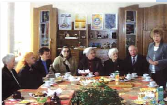
Творческая встреча ветеранов Калинковичского района в г. Мозыре.

В рамках акции «Мы обращаемся к потомкам» идет постоянный сбор материалов для создания и обновления педагогических музеев, музеев трудовой и боевой славы.