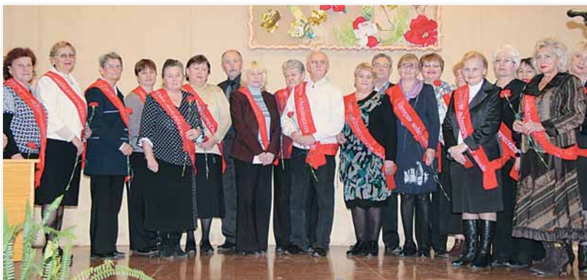
Расширенное заседание совета ветеранов «Золотой фонд», посвященное Дню защитников Отечества и Дню женщин.

с ветеранами: анализ состояния и перспективы». Во всех первичных профсоюзных организациях созданы комиссии по работе с ветеранами, избраны председатели советов ветеранов. Особенно активизировалась работа после проведения районного смотра-конкурса на лучшую постановку работы с ветеранами педагогического труда в учреждениях образования. Благодаря глубокому взаимопониманию, принятому Соглашению между районным отделом образования и районной организацией профсоюза работников образования и науки сложилась стройная система работы с ветеранами педагогического труда. На расширенных заседаниях Советов чествуют ветеранов, вручают удостоверение «Почетный ветеран педтруда Первомайского района г. Витебска».