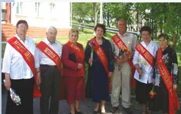
Ветераны на праздновании Дня Победы.

участник войны не обойден вниманием в повседневной жизни.