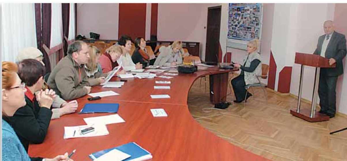
Областной семинар в Брестском государственном техническом университете, 2012 год.