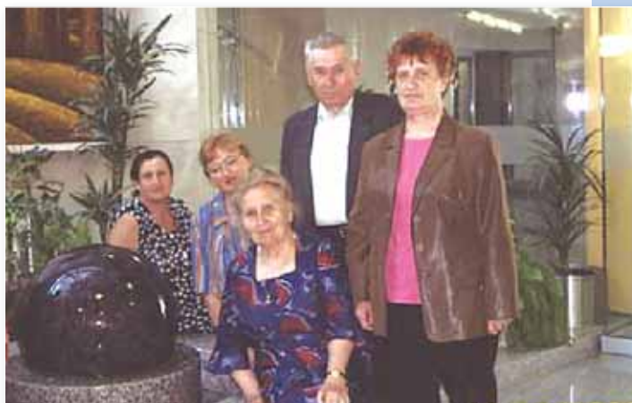
Ветераны педагогического труда на экскурсии в Национальной библиотеке.

Эффективно работает в районном совете комиссия «Наши секреты». Ею подготовлены и проведены конкурсы и выставки: «Беларусь – уютный дом» – на лучший дизайн приусадебного участка и домовладения (2006 – 2007 гг.); «Наши руки не знают скуки» – конкурс декоративно-прикладного искусства с последующей выставкой в районном Доме