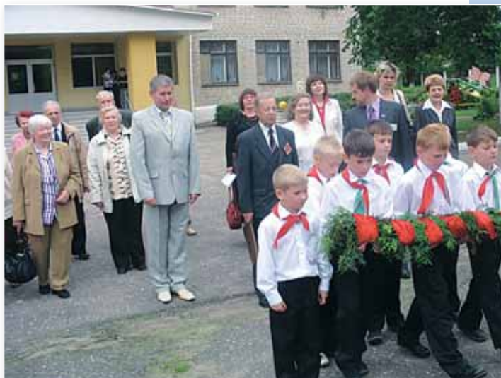
Торжественный прием в пионеры в Радошковичской школе-интернате, 2010 год

Более 7 лет радует душевными песнями своих коллег, учащихся и жителей Солигорского района хор ветеранов педагогического труда и профсоюзного движения региона «Вдохновение».