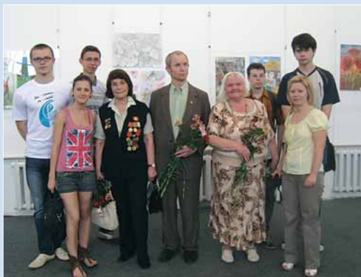
Участники открытия выставки «Дети войны», организованной Белорусским союзом блокадников Ленинграда, 2013 год