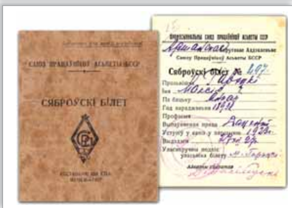
Профсоюзный билет Максима Горьцкого, основателя современной национальной прозы