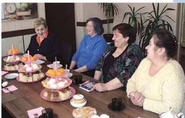
На Пасхальной встрече: обмен рецептами куличей.

Заседания клуба проводятся 1 – 2 раза в месяц, они отличаются разнообразием тематики. Это и рождественские встречи, и «кухонные посиделки», и беседы с врачом районной поликлиники, и посещения выставок, музеев, участие в презентациях и многое другое.