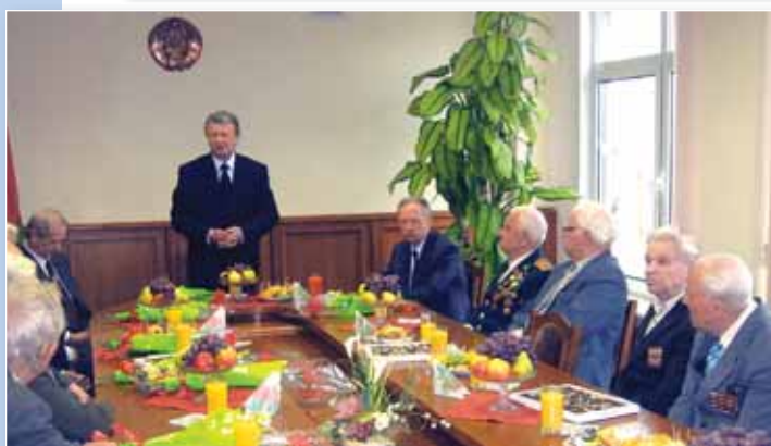
Встреча министра образования Республики Беларусь А.М. Радькова с ветеранами, 2010 год

В республике целая армия образованных, грамотных и талантливых педагогов, к сожалению, не всегда востребованных. И если раньше они учили детей честно, полезно, добропорядочно и красиво жить, то теперь им самим приходится доказывать, что красиво должны жить и в пожилом возрасте, что с выходом на пенсию жизнь не заканчивается.