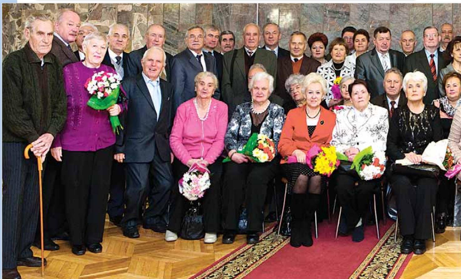
Международная акция «Пламя Победы», 2013 год