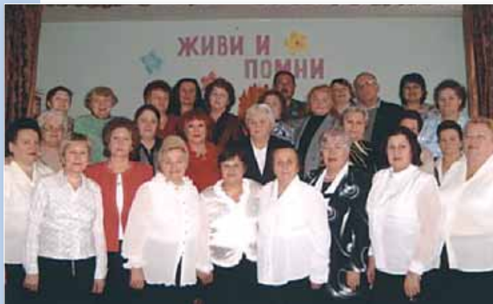
Участники вечера «Живи и помни» в районном Доме детского творчества.

Акция «В класс пришел ветеран» – традиционное направление работы советов ветеранов. Постоянному сотрудничеству ветеранов с учебными заведениями, где они частые гости, уделяется должное внимание.