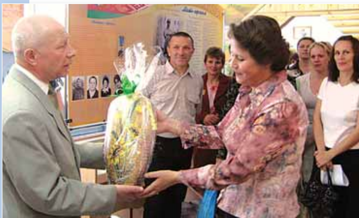
В музее гимназии.