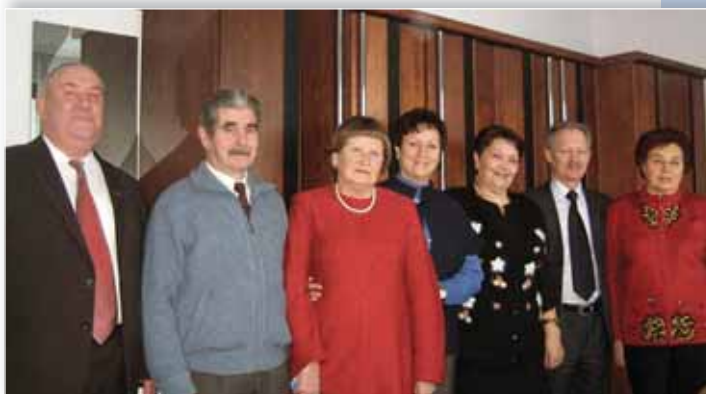
Встреча с ветеранами – руководителями отраслевого профсоюза, 2011 год.

Республиканский совет совместно с ЦК профсоюза работников образования и науки ежегодно проводит расширенные