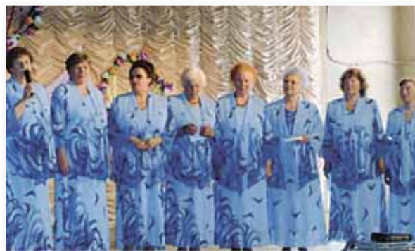
Вечер-чествование ветеранов педагогического труда «Тепло души твоей».