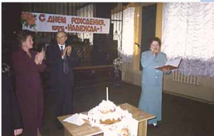
В гостях у ветеранского клуба «Надежда».