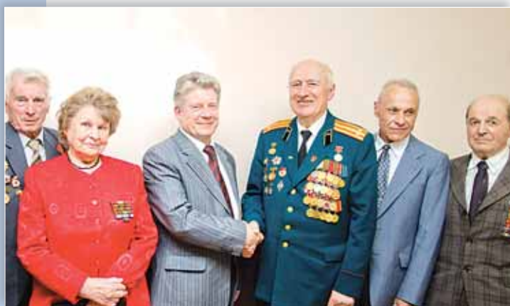
Министр образования Республики Беларусь С.А. Маскевич с ветеранами Великой Отечественной войны, 2012 г.

Были организованы посещения Национальной библиотеки, мемориального комплекса «Линия Сталина», Брестской крепости, Беловежской пуши, Софийского собора, ряда учебных заведений республики. Расширенные заседания проведены в Брестской, Витебской, Могилевской областях, где участники могли ознакомиться с опытом работы ветеранских организаций.