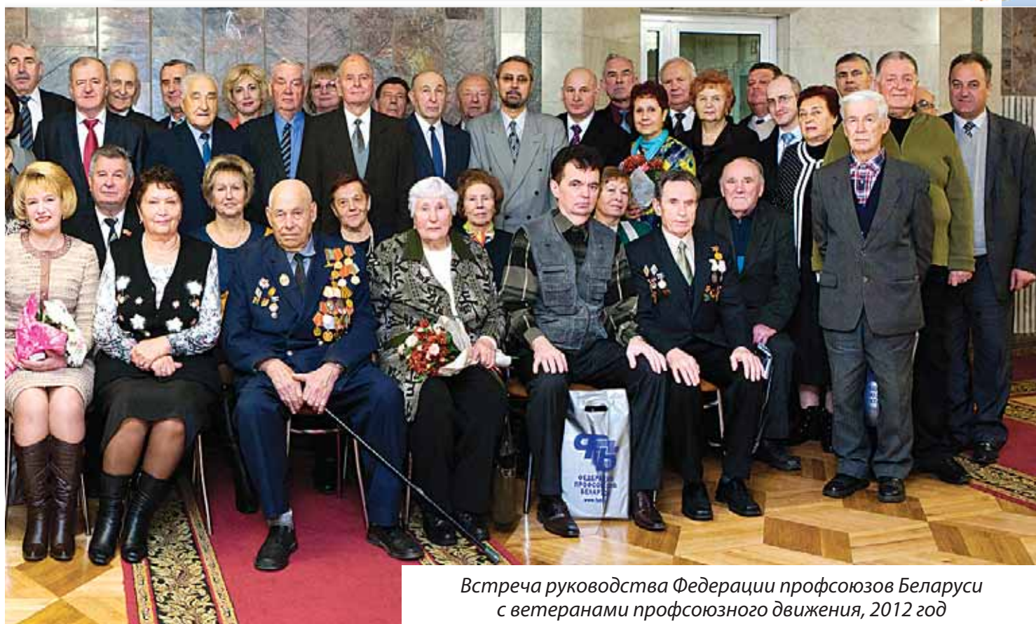
Встреча руководства Федерации профсоюзов Беларуси с ветеранами профсоюзного движения, 2012 год