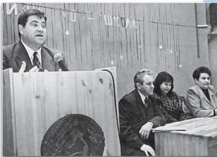
Министр образования В.И. Стражев (2000 г.) выступает перед ветеранами педагогического труда и профсоюзного движения.

Центральный комитет Белорусского профессионального союза работников образования и науки принял на себя почетную обязанность – уделять серьезное внимание деятельности ветеранских организаций.