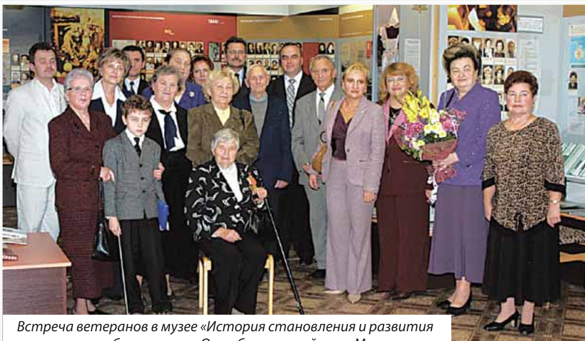
Встреча ветеранов в музее «История становления и развития системы образования в Октябрьском районе г. Минска»

ветеранов педагогического труда столицы. На семинарах, конференциях педагоги-пенсионеры активно участвуют в обсуждении проблем и достижений образования, знакомятся с опытом и инновационно-образовательными проектами педагогов города, обучаются на курсах по компьютерной грамотности в рамках международных проектов “образования без границ для пожилых людей”.