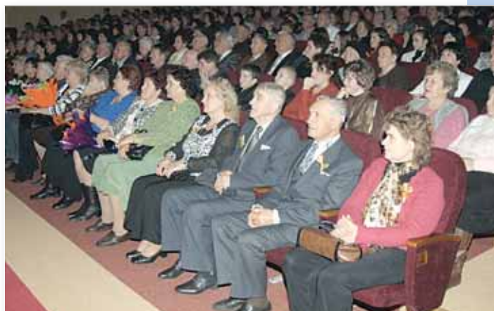
29 октября 2010 г. школа отметила 100-летний юбилей. Празднование не могло состояться без ветеранов. Первые ряды – только для них!

Только тот, кто работал в школе, Кто всю чашу испил до дна, Тот поймет, почему так больно Слышать – первое сентября! Тот поймет, почему так сладко Видеть осени приближенье, Кто всю ночь просидел с тетрадками, Видя в строчках сердец горенье. Пробегают осени, зимы, И весна зашумит ручьями, Выпуск каждый – неповторимый, Он всегда остается с нами. Первый день сентября и последний звонок – Так проходят все дни за днями. Кажется, лишь вчера был твой первый урок, Но уже нас зовут ветеранами. Наше сердце в полете как птица, И волнение в груди под вечер. От весны голова кружится, Ветеран ведь от слова – ветер! Не стареют душой ветераны. И пускай пролетают года Мы верны нашей юности славной, Потому что душа молода!