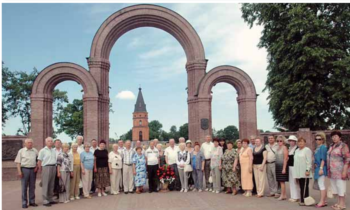
Участники заседания Республиканского совета ветеранов педагогического труда на Буйничском поле, 2011 год

В области в 2011–2012 гг. прошел смотр-конкурс на лучшую первичную профсоюзную организацию по работе с ветеранами педагогического труда. Мероприятие дало новый импульс заботе о ветеранах.