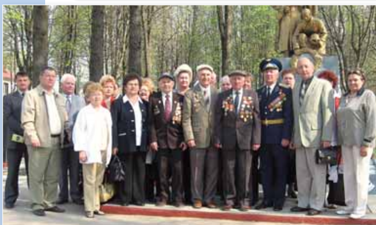
Выездное заседание ветеранской организации «Золотой фонд» по местам боевой славы Витебского района.

Тесное сотрудничество осуществляется между профсоюзными и ветеранскими организациями Железнодорожного и Первомайского районов.