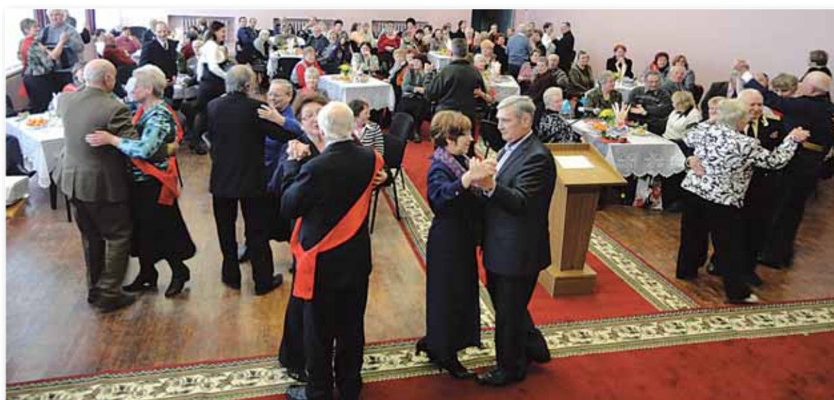
«Сердце, отданное детям...» – торжественное мероприятие, посвященное Дню пожилого человека.

Накоплен богатейший материал по работе с ветеранами Великой Отечественной войны и труда. Все проводимые мероприятия отражены в фотолетописи.