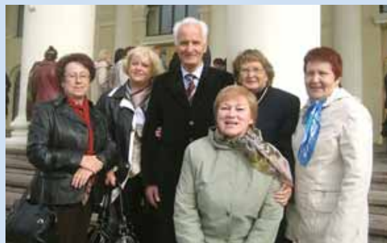
Ветераны профсоюзного движения – участники VI Съезда Белорусского профессионального союза работников образования и науки, 2010 год