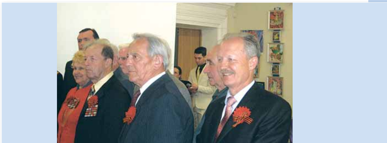
Торжественная встреча ветеранов накануне праздника Великой Победы, 2013 год