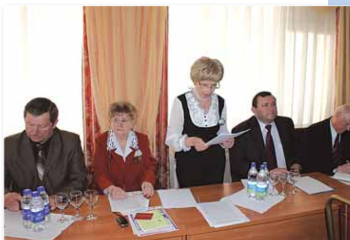
Областной совет ветеранов. Отчетно-выборная конференция.

По случаю юбилеев ветеранов педагогического труда и ветеранов ВОВ организуются поздравления в местных СМИ, выпускаются специальные стенгазеты, проводятся чествования в торжественной обстановке с вручением памятных подарков, на льготных условиях выделяются путевки для оздоровления, оказывается материальная помощь,