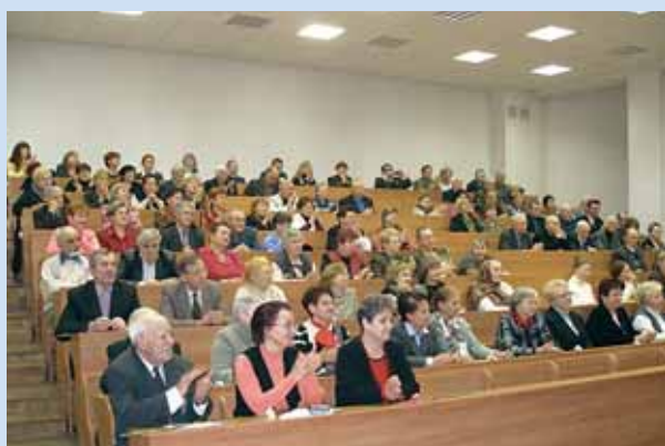
Собрание совета ветеранов Витебского государственного технологического университета