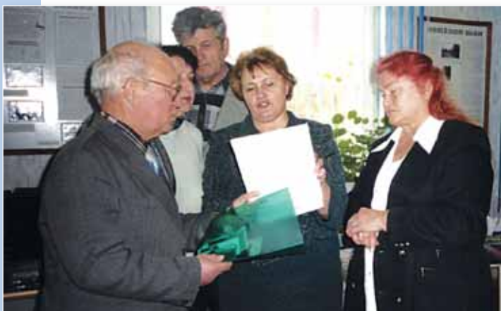
Члены Калининковского районного совета ветеранов в музее поселка Озаричи.

Вызывает большой интерес музей воинов-интернационалистов, среди них 290 уроженцев Калининковского района.