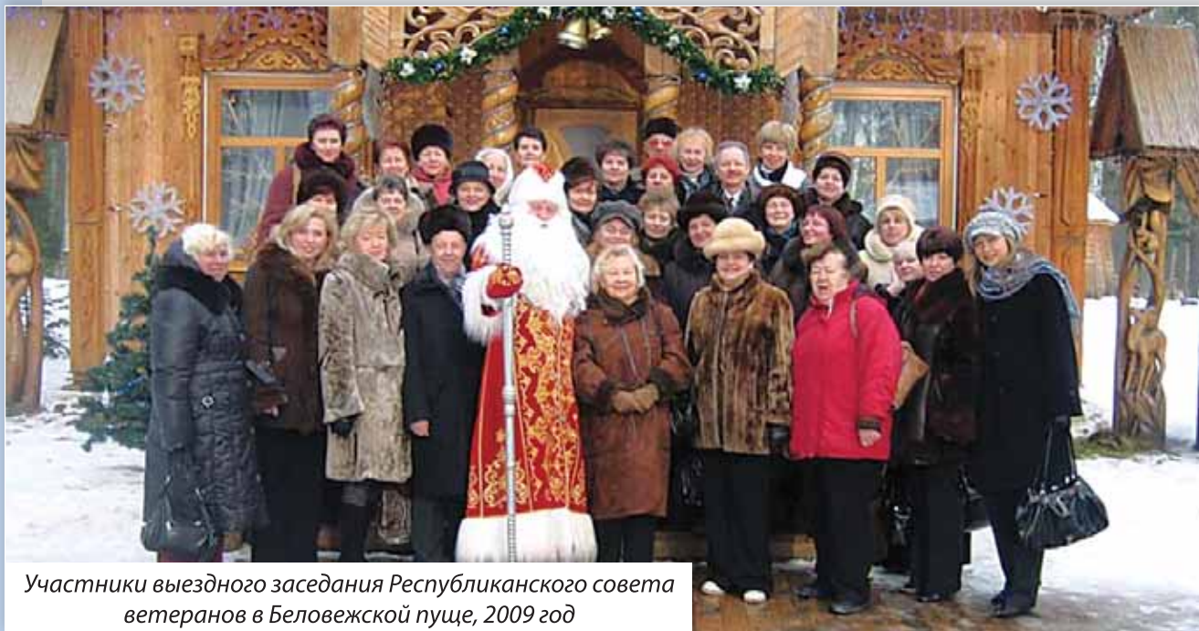
Участники выездного заседания Республиканского совета ветеранов в Беловежской пуще, 2009 год

Хорошей практикой стали областные семинары, проводимые областным советом совместно с обкомом профсоюза. В 2007 году в рамках акции «Совет ветеранов – наш дом» на базе Пинского районного комитета отраслевого профсоюза прошел семинар для председателей районных, городских комитетов профсоюза на тему «Взаимодействие и сотрудничество Пинского районного комитета отраслевого профсоюза, отдела образования Пинского райисполкома и Совета ветеранов педагогического труда». В 2010 году на базе Брестского городского совета ветеранов системы образования состоялась встреча председателей региональных отраслевых ветеранских организаций, которые смогли ознакомиться со спецификой работы с ветеранами в г. Бресте, поделиться собственными наработками, обсудить насущные вопросы и задачи.