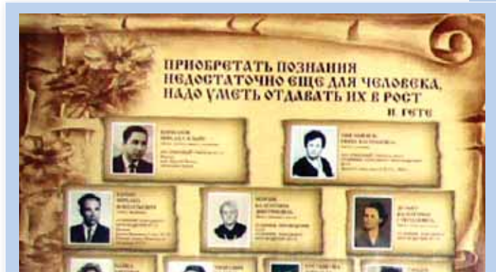
Стенд в школе, посвященный педагогам-ветеранам.