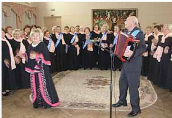
Выступление хора клуба «Оптимист»

Совместно с председателями районных и городского советов клуб организует тематические и авторские музыкально-литературные вечера, поддерживает тесную связь с литературными музеями Янки Купалы, Якуба Коласа, Максима Богдановича, с музеем белорусского языка и литературы, с клубом «Резонанс» при библиотеке им. А.С. Пушкина, с поэтическим клубом «Вдохновение» при Республиканском Дворце культуры ветеранов. Совет клуба организует встречи с интересными людьми, организует экскурсии по замечательным местам Беларуси.